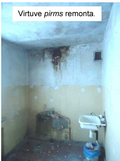
Virtuve pirms remonta.

Par labdarības tirdziņā saziēdotajiem līdzekļiem draudzes remontbrigāde kopā ar draugiem jau ir izremontējusi kādas ģimenes dzīvokli Bunkas pagastā – dzīvoklī tika salabots dūmvads, nomainītas grīdas, griesti, izlīmētas tapetes, sakārtota ūdens sistēma, izremontēta virtuve, tualete, istabas. Tika uzstādīts ar malku kurināms ūdensboleris. Ģimenei tika nopirkta veļasmašīna un neliels ledusskapis. Ģimene bija ļoti iepriecināta. Kā var redzēt no bildēm, remonts šīs ģimenes dzīvoklī tiešām bija akūti nepieciešams, bet ģimenei pašai nebija līdzekļu, lai to veiktu. Paldies visiem ziedotājiem, kā arī remonta realizētājiem, palīgiem, atbalstītājiem par šai ģimenei