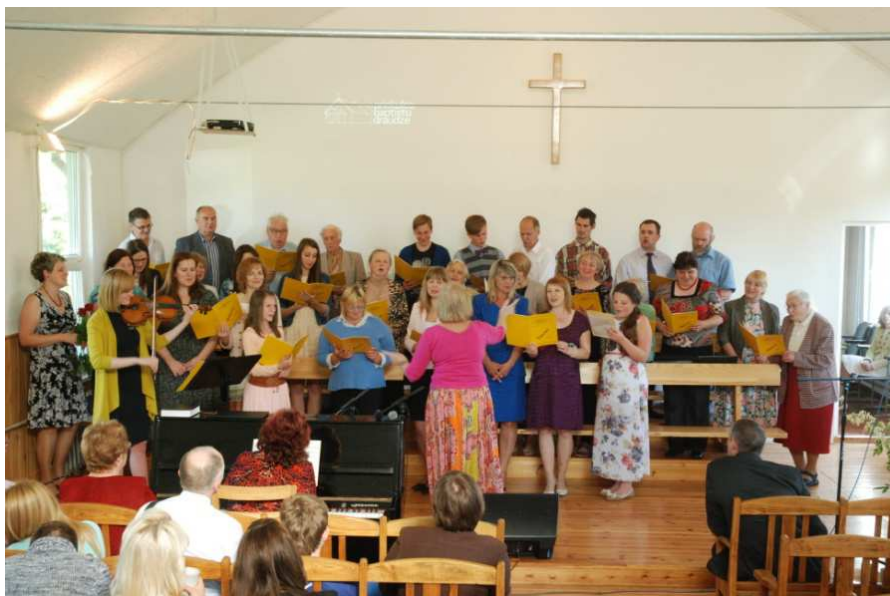
Priekules baptistu draudzes esošo un bijušo dziedātāju kopkoris