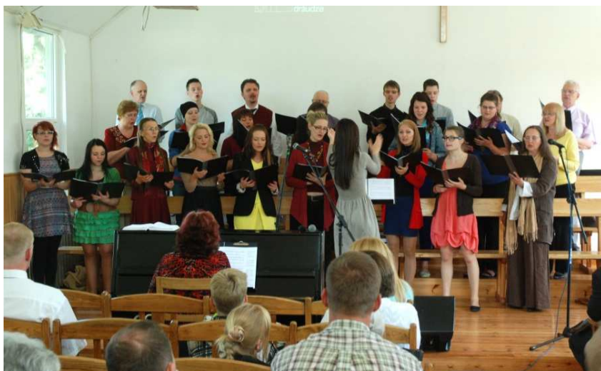
Liepājas Ciānas baptistu draudzes kamerkoris

Pēc dievkalpojuma turpinājās sadraudzība, kurā draudzes esošo un bijušo koristu kopkoris dziedāja brīnišķu pateicības dziesmu Dievam, sveicām kora ilggadējos vadītājus un pianistus, saņēmām sveicienus no viesiem un pateicāmies par kora 135. gadiem un Dieva vadību cauri tiem jau no 1879. gada.